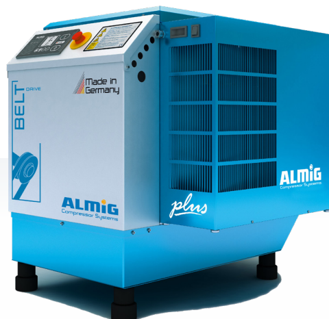
BELT 4-37 "PLUS"