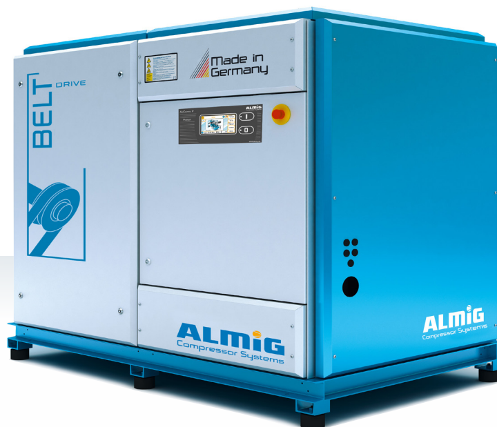
BELT 38 –55