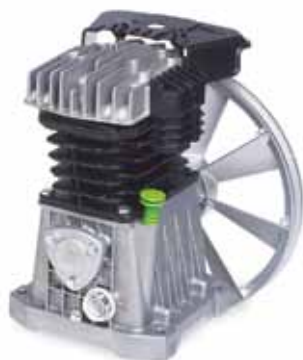
Двухцилиндровая одноступенчатая поршневая группа АВ 360

Двухцилиндровая одноступенчатая группа имеет два цилиндра одинакового диаметра. Оба они поочередно всасывают атмосферный воздух, сжимают его до максимального давления и вытесняют в линию нагнетания.