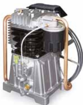
Двухцилиндровая двухступенчатая поршневая группа АВ 671

Клиноременный привод компрессорной группы обеспечивает оптимальную частоту вращения коленчатого вала на уровне 1000-1500 мин -1 , что позволяет уменьшить износ поршневых колец и внутренней поверхности цилиндров.