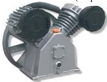
Узел насоса LB50 (старый)